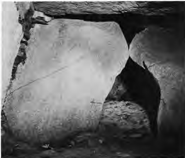
Fig. 3. Indgangen til bikammeret. Stenen til højre er kunstigt tildannet.

I jættestuens 10 m lange hovedkammer var den østlige ende afgrænset fra det øvrige kammer af en lang, smal helle sat på højkant i gulvet. Oprindeligt har den utvivlsomt nået fra væg til væg og således dannet en lukket kiste mod