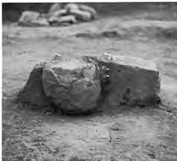
Fig. 9. Urnebrandgrube fra ældre jernalder på den nordlige del af gravpladsen. Brændte knogler og trækul udfyldte lerkarret og lå tæt pakket i gruben, hvori det var placeret.

Resultatet af de omfattende prøvegravninger må altså siges at være ret negativt. Og dog er fund og manglende fund af største vigtighed for bedømmelsen af pladsen som et samlet hele. Den oplysning, at terrassen kun har tjent som begravelsesplads for dem, der findes bisat i stengravene og ikke samtidig er hvilestedet for en hypotetisk underklasse, der kunne tænkes stedt til hvile i simple jordgrave, er yderst værdifuld, selv om det må indrømmes, at forholdene havde været klarere, hvis jordgrave havde ligget spredt i stort tal over pladsen eller i dens udkanter. Nu må vi filosofere over, hvorfor de ikke findes, dog uden at finde svaret. »Underklassen« kan have haft en selvstændig gravplads, dens døde kan ligge i een af de tre storstensgrave, og da vel i jættestuen eller, det må nævnes som alternativ, »underklassen« har slet ikke eksisteret, undtagen i hypotesen. Den sidste mulighed kan man ikke se bort fra, ihukommende Barkærs rækkehuse med ens store »lejligheder« 12 ). Et endeligt svar kan ikke gives.