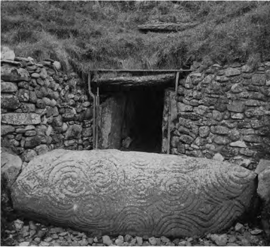
Fig. 5. Forgården til den store jættestue ved New Grange i Irland med dekoreret sten umiddelbart foran indgangen.

The forecourt immediately in front of the entrance to the large passage grave at New Grange in Ireland, with its ornamented stone.