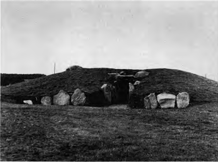
Fig. 4. Den færdigrekonstruerede jættestue, set fra syd. Stenene i forgrunden danner facade mod ceremonipladsen. Bag dem har offerkarrene været placeret.

The restored passage grave, viewed from the south. The stones in the foreground form the facade facing on the offering area. The safrificial vessels were placed behind them.