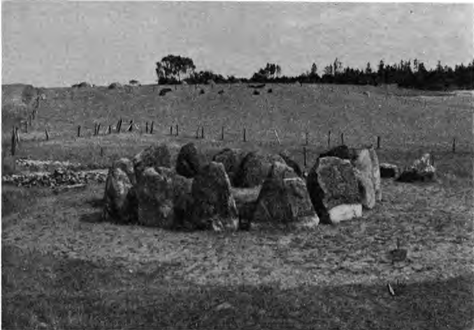
Fig. 1. Den rekonstruerede runddysse med dens 2 meter høje randsten, set fra nord. The restored round dolmen with its 2-meter high ring-stones, viewed from the north.