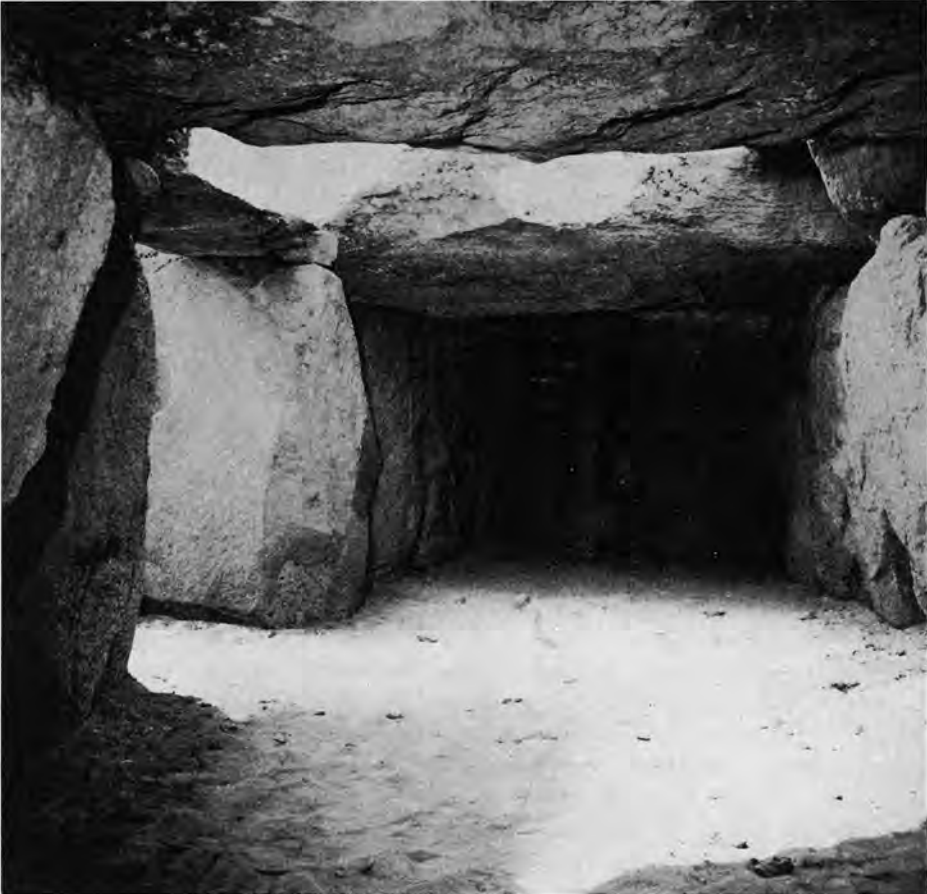
Fig. 6. Jættestuens 10 m lange kammer efter restaureringen. The chamber of the passage grave, 10 meters long, after restoration.

bønderne transporteret, måske lange strækninger med løftestænger, tove, slæder og ruller som eneste hjælpemiddel. Alene dette forhold aftvang den dybeste respekt. Men dertil kom iagttagelsen af den store nøjagtighed, hvormed man havde udnyttet det højst uensartede materiale. Et enkelt træk er nok til at illustrere dette forhold: dækstenenes placering. Deres spændvidde var udnyttet til det yderste over for det 3 m brede kammer. Kun få centimeter havde de at hvile på ved hver side, men nok til at bide sig fast og skabe stabilitet. Før bygningen overhovedet er påbegyndt, må alt bygningsmaterialet være slæbt sammen, her ialt 40 sten med en vægt mellem en halv og ca. 20 tons, hver sten være nøjagtigt opmålt og tildelt sin plads og funktion. Først når det var sket, kunne den nøjagtige størrelse på kammeret fastslås, et omrids stikkes af i marken og arbejdet med opførelsen påbegyndes. Det kan ikke være amatører, der har bygget vore jættestuer, lederne må have været skolede folk, så at sige arkitekter af fag,