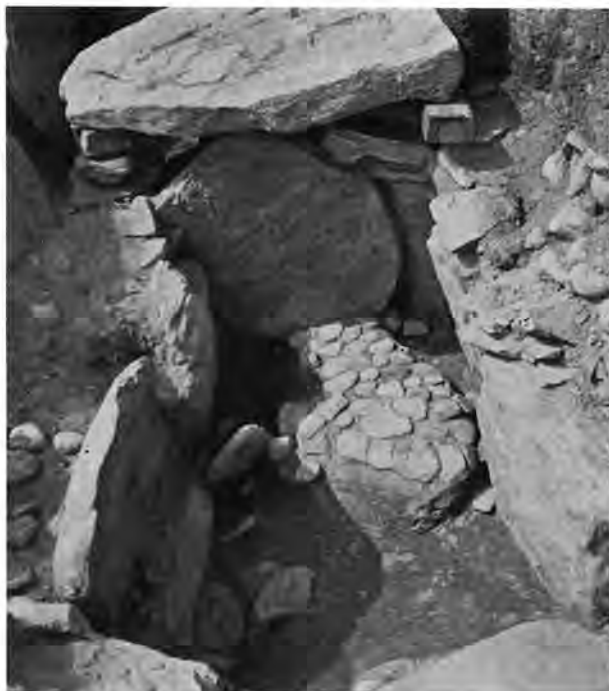
Fig. 2. Jættestuens bikammer med stenbrolagt gulvflade umiddelbart efter afdækningen, set fra sydvest.

The secondary chamber of the passage grave with its cobbled floor, immediately after excavation, viewed from the southwest.