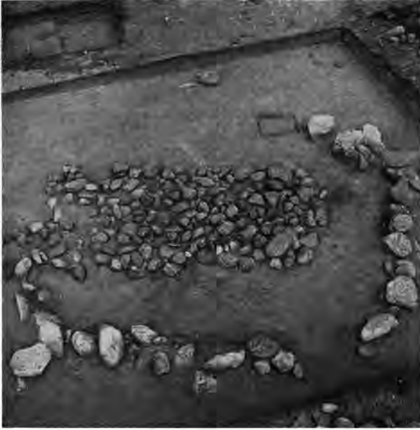
Fig. 10. Brandgrav, formodentlig fra ældre jernalder, imellem jættestuen og runddyssen. I udkanten af det rektangulære stentæppe inden for stenkredsen lå en bunke brændte knogler opblandet med trækul.

Cremation burial, presumably from the Early Iron Age, between the passage grave and the round dolmen. At the edge of the rectangular stone paving within the stone circle lay a heap of burnt bones mixed with charcoal.