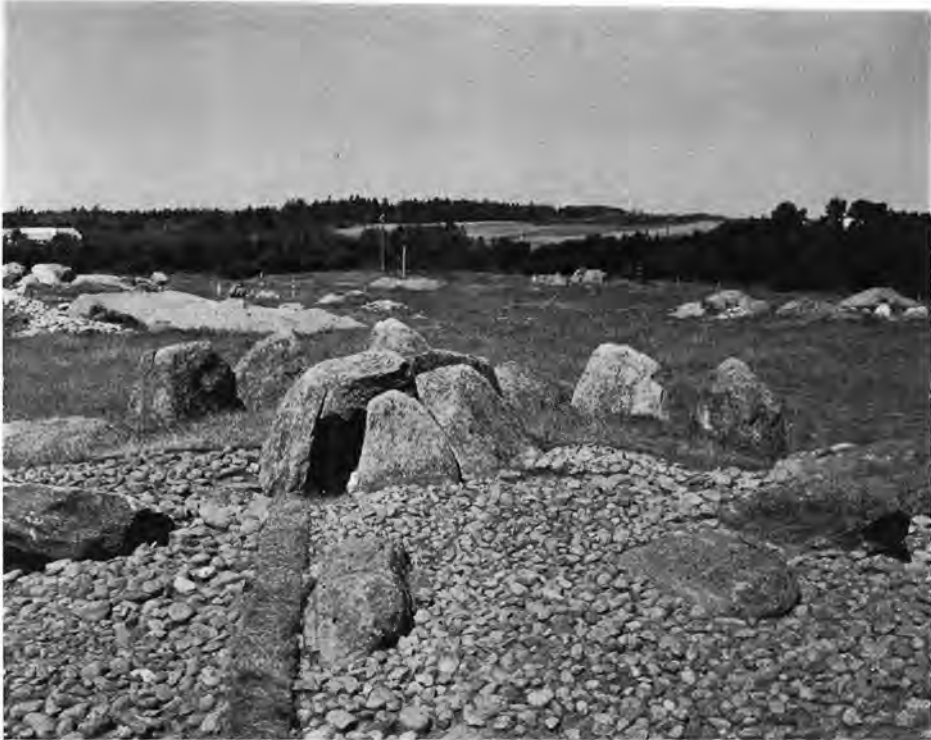
Fig. 7. Runddyssen under udgravning, set fra syd. Under stenmasserne foran randstenene fandtes offerkar. The round dolmen in the course of excavation, viewed from the south. Sacrificial vessels were found under the heaps of stones in front of the ring-stones.

hvilken der fandtes rester. I urnen fandtes kun enkelte brændte knogler, de resterende var pakket ned omkring urnen, hvor de, opblandet med kul, udfyldte gruben. Knoglestykkerne var ret store, og enkelte hele, omend ildskørnede og krakelerede småknogler kunne frempensles. Denne gravtype, urnebrandgruben, er typisk for keltisk jernalder, selv om den på Djursland dog også forekommer i den umiddelbart tilstødende tidsgruppe, yngre bronzealder. Nabograven, der lå under den samme stenlægning, bestod blot af en flad grube i jorden, fyldt med en blanding af kul, sand og brændte knogler. Øverst i gruben lå jernnålen som det eneste gravgods. Også denne grav må dateres til ældre jernalder, og formentlig samme tidsafsnit som foregående, yngre keltisk jernalder.